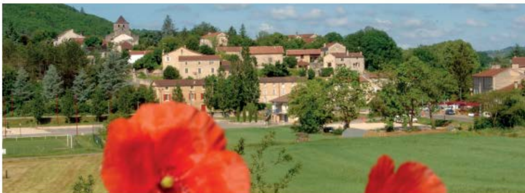
Préserver la qualité de vie passe par le Plan Climat Air Energie Territorial

Les travaux d'élaboration du PCAET (Plan Climat Air Energie Territorial) du Grand Cahors se poursuivent. Cet outil donne au territoire une ligne de conduite pour limiter le changement climatique, développer les énergies renouvelables et améliorer la qualité de l'air.